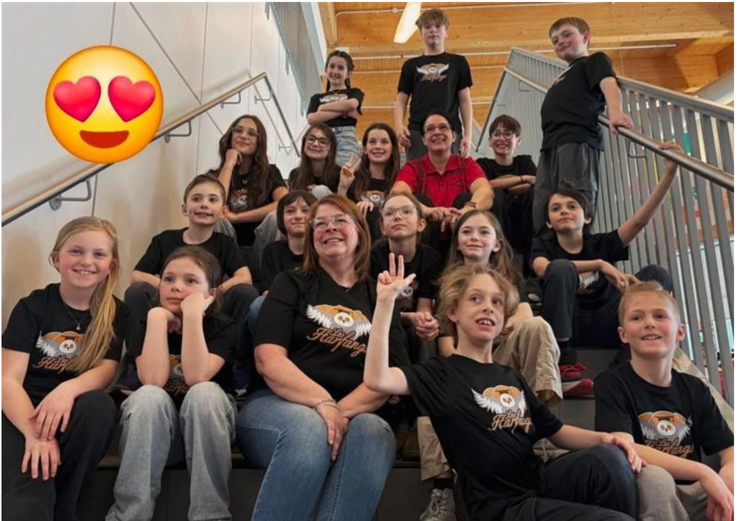
L'équipe de direction d'Harfang-des-Neiges